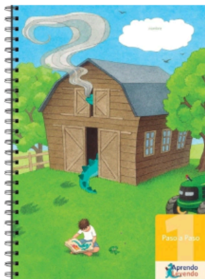
CUADERNILLO 1, PASO A PASO